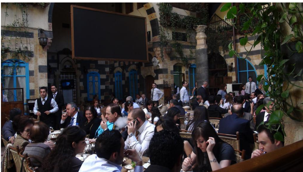
Restaurant in Damaskus:

Das Geschäftsleben scheint intakt, soweit ich es auf dieser Reise beurteilen konnte (wengleich das Gedränge in den Bazars von Damaskus und Aleppo zu anderen Zeiten vermutlich stärker ist), die Lokale der Einheimischen sind teilweise gut besucht, die Leute rauchen Wasserpfeife, spielen leidenschaftlich Karten und unterhalten sich angeregt (oft auch per Handy); ob die Stimmung anders ist als sonst, kann ich nicht beurteilen.