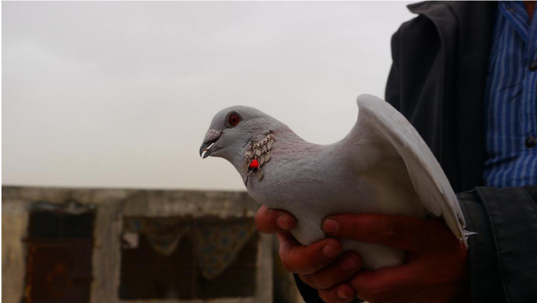
Zuchttaube mit silbernem Ohrring

allerdings ein schlechtes Image, denn man hält sie für notorische Lügner. Darum werden sie als Zeuge vor Gericht erst gar nicht zugelassen . . .