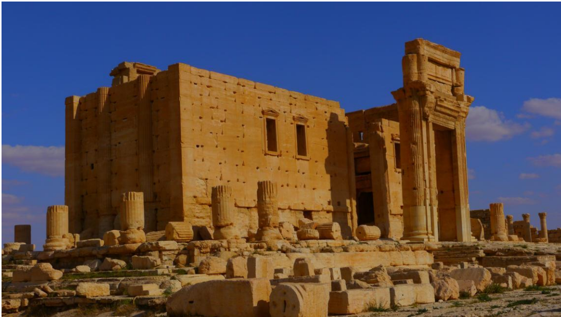
Palmyra: Der berühmte Baal-Tempel -ganz ohne Touristen

Reiseverkehr vermutlich komplett zum Erliegen gekommen sein. Der berühmte Baal-Tempel war bei meinem Besuch menschenleer, wie das folgende Bild zeigt.